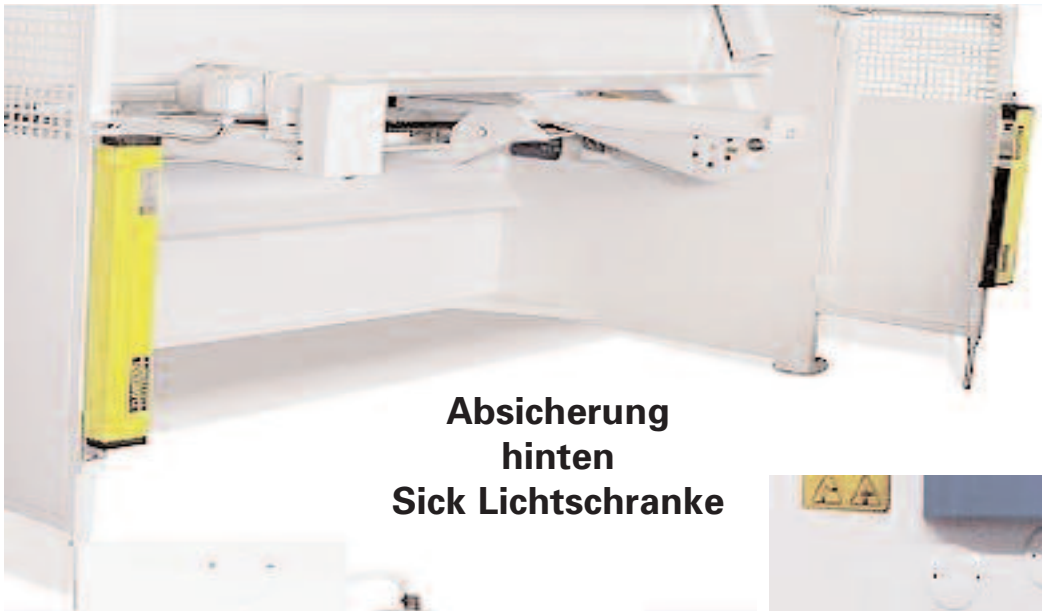
Absicherung hinten Sick Lichtschanke