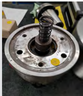
Št. 26: 3- čeljustna vpenjalna glava Ø 160 mm Podjetje Röhm