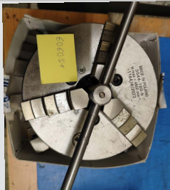
Št. 30: 3- čeljustna vpenjalna glava Jeklo, DIN 55029