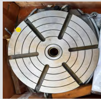
Št. 20: Univerzalna delilna glava FW 100