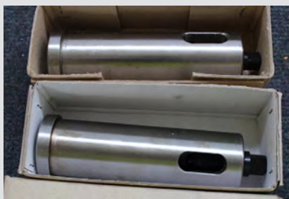
Št. 25: Morsejev stožec HH2-40-MK4