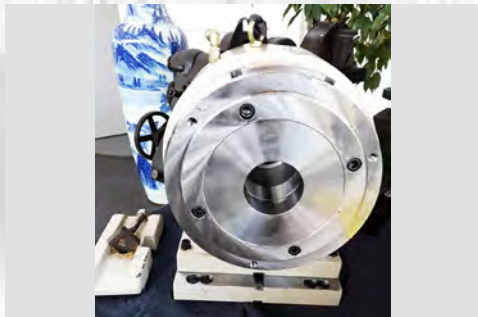
Št. 15: Protiležaj DAS-320 za 4 osi