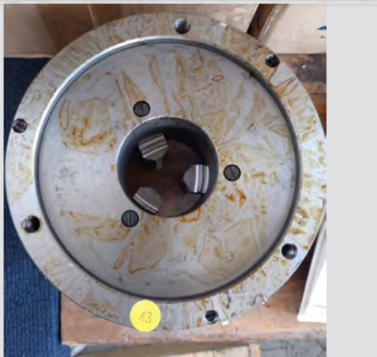
Št. 13: 3- čeljustna vpenjalna glava Ø 160 mm , DIN 6350, jeklo