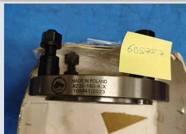
Št. 31: Prirobnica držala 8230-160-6-X