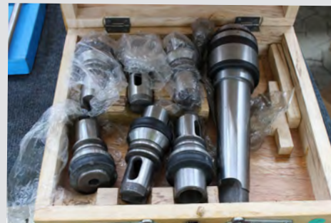
Št. 23: Sistem za hitro menjavo orodja MK 5 za PRC 50