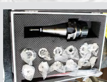
Št. 29: Nosilec vpenjalne sponke ER 32/ BT 40