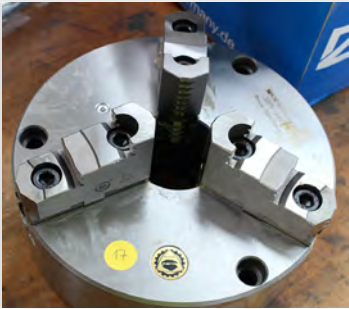
Št. 17: T3- čeljustna vpenjalna glava BISON; Ø 200 mm; litina; DIN 6350