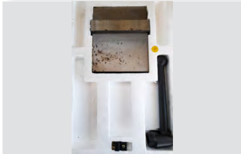
Št. 11: mehatronsko držalo širine 160 mm / višine 45 mm