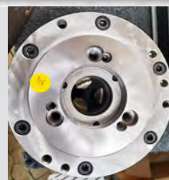
Št. 28: 3- čeljustna vpenjalna glava BISON DIN 55029 Ø160 mm KK4