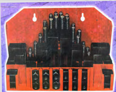
Št. 21: Sistem vpenjanja za konvencionalni vrtalno-frezalni stroj