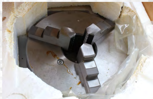
Št. 16: 7 x 3- čeljustna vpenjalna glava WDSE 360 Original