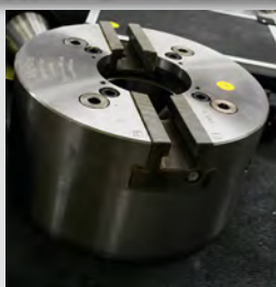
Št. 27: 3- čeljustna električna vpenjalna glava KFD-HS 250/2